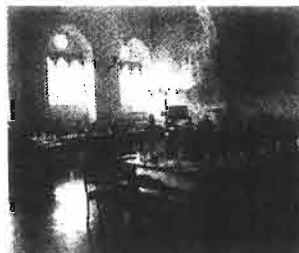
Il consiglio comunale

TODI - Si terrà oggi pomeriggio, alle 18.30, il consiglio comunale cittadino. All'ordine del giorno la realizzazione del parcheggio interrato del Mercato Vecchio e la vendita dell'ex scuola comunale di Torre-vecceona. Se dovesse mancare il numero legale il Consiglio si riunirà lunedì.