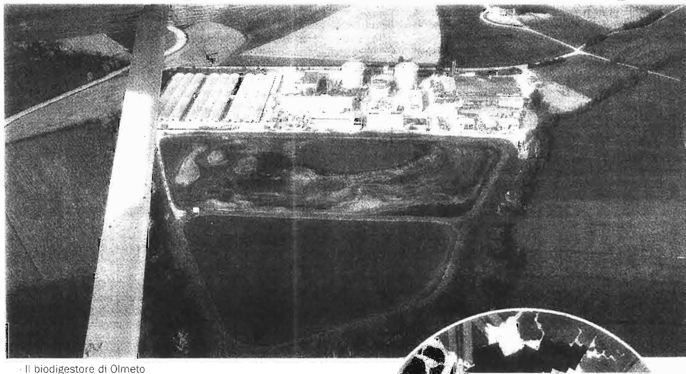
Il biodigestore di Olmeto

MARSCIANO - Wwf, Fondo ambiente italiano e Legambiente lanciano l'allarme inquinamento nell'area nord del Marscianese e chiedono l'opposizione del vincolo paesaggistico. In un dossier realizzato dalla tre associazioni, dal Comitato antinquinamento di Marsciano e dall'Associazione per la salvaguardia e lo sviluppo del contado di porta Eburnea si denunciano le criticità e i rischi del territorio, a partire dai rifiuti derivanti dalla possibile riapertura del biodigestore di Olmeto. “L'impianto - si legge nel documento delle associazioni - nato nel 1989 per lo smaltimento dei reflui sismici del comune di Marsciano, è stato chiuso ad agosto 2009 e in 20 anni di attività ha creato grossi problemi ambientali. Attualmente la situazione è ancora di