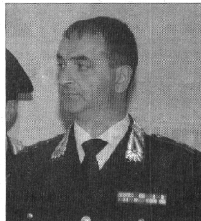
Noe Il capitano Schienalunga

colo, e vale a dire prodotti di scarto dell'agricoltura e della zootecnia. Per altro con il vantaggio di ottenere una sensibile riduzione degli impatti ambientali. Ma questo non può essere il caso del sangue dei mattatoi né per le sanse dei frantoi. Per queste ultime al pari dei reflui degli allevamenti è previsto lo spandimento in agricoltura sulla base di precise norme e due specifici decreti ministeriali che prevedono dettagliate modalità di impiego. Il tutto, per farla breve, fa capo alla più generale e specifica disciplina sui rifiuti,